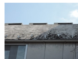
みすぼらしくなりやすいアスファルトシングル

なかなか屋根を見て歩くことは少ないと思いますが、おのずと目に飛び込んでくる風景には屋根が写り込んでいると思います。そこにはみすぼらしくなった屋根よりも、それぞれの住宅で個性のある美しい屋根があるといいですね。