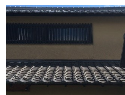
いぶし銀の美しい瓦屋根

しかし瓦屋根ですと、10年に一度程度の定期点検ぐらいで済みます。屋根の形状にもよりますが、瓦屋根の方が塗装補修工事が不要なことを考えると、長い目で見ると安くなるケースがほとんどです。そしてなにより瓦屋根の見た目の風格と美しさを感じられ、住宅全体に愛着も湧いてきます。長期的にみると決して高くない瓦、しかも美しい瓦です。ぜひ見直してみましょう。