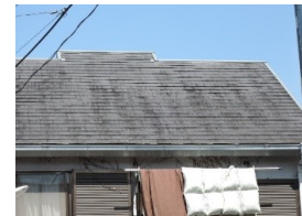
塗替える前の化粧スレート