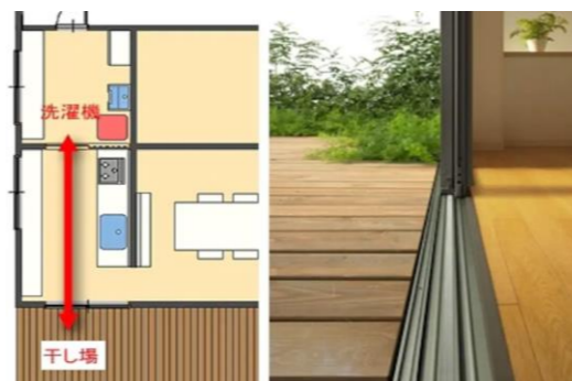
段差の解消ができるウッドデッキ設置例

洗濯に伴う水まわりバリア解消のコツは、洗濯機と同じフロアに物干し場の確保を行い、距離はできるだけ短く、途中の階段や段差を無くしておくことです。