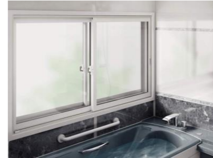
内窓を取付けた浴室

太陽の光が入りにくい北向きの窓は、できるだけ高い位置に取付けることで、部屋を明るくすることができます。お勧めは天窓の取り付ける窓リフォームです。同じ面積で通常の3倍の明るさがあり、光の量が安定しているので、落ち着いた部屋になります。